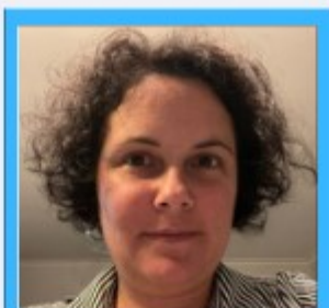
Line JASMIN RH