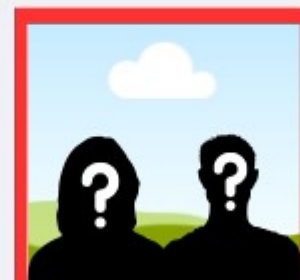
Vous?? transition énergétique?